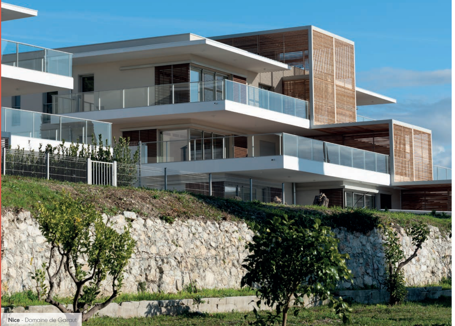
Nice - Domaine de Gairaut